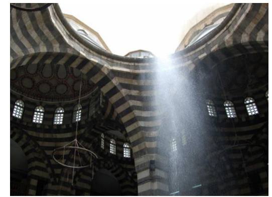
Damaskus – Khan As'ad Pasha